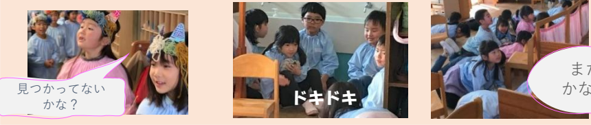
見つからないかな？

楽しみにしていた豆まき。お部屋にバリエードを作って、こぼと鬼たちが来るのをドキドキ・ワクワクしながら待ちました。あまりに張り切って豆を投げたので、こぼと鬼たちは入口あたりでビックリして、すぐに退散してしまいました。その後、鬼に変身して次は、こうさぎ3組のお部屋へ、「抜き足、差し足、忍び足・・・」階段から足音を忍ばせて突入！こうさぎさんだから優しく・・・とは思っていたものの、思いのほか強い豆がたくさん飛んできて「やられた～」と逃げて帰ってきました。なんとも言えないドキドキ感で楽しみました。