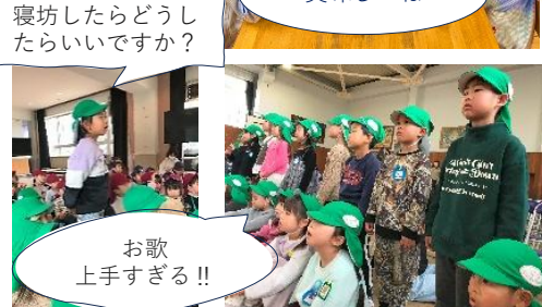
寝坊したらどうしたらいいですか？