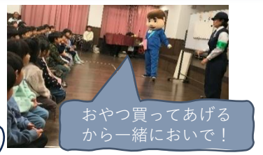
おやつ買ってあげるから一緒においで！