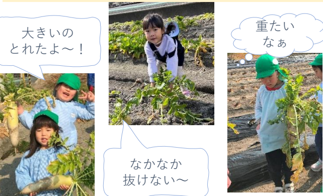
大きいのとれたよ～！

12月から気になっていた大根抜き！畑を横目に登園し、「だんだん少なくなってきた」「葉っぱが元気がないかも」と心配していましたが、立派な大根が植わっていました。力いっぱい引っ張って、しっかり抱えて持って帰ってきました。