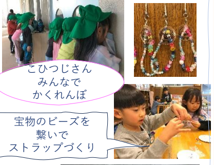
こひつじさん みんなでかくれんぼ

日々の生活の中での小さいことから、楽しかった行事のことなど、沢山のやりたいこと。中でも「デイキャンプをもう一回したい！」「宇宙にみんなで行きたい！」との壮大なやりたいこと(笑)の中で何が出来るか？を考えて宇宙キャンプファイヤーごっこを計画し、お部屋を暗幕で真っ暗にして宇宙の世界にし、宇宙船を作り、宇宙に行ってキャンプファイヤーを楽しみ、ライトの明かりでキャンプご飯を食べる!!と張り切っています。卒園までもう少しですが、みんなでやりたいことをひとつひとつ楽しんで過ごしたいと思います。