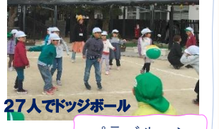
27人でドッジボール